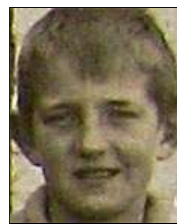
Række I nr. 12