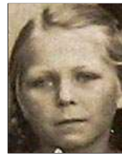
Række III nr. 6