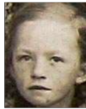
Række III nr. 4