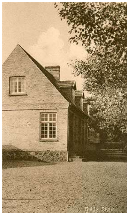
Fjelde Skole. Postkort 1920'erne?

Realsk.1951 Sakskøbing Realsk.1953 Sakskøbing Realsk.1955 Sakskøbing Realsk.1958 Sakskøbing Realsk.1958 Soesmarke Skole 1912 Soesmarke Skole 1938 Soesmarke Skole 1941 Soesmarke Skole 1946 Soesmarke Skole 1950 Soesmarke Skole 1954 Soesmarke Skole 1957 Taars Skole 1955 Taars Skole 1958 Vignæs Skole 1941 Vignæs Skole 1947