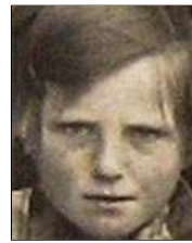
Række III nr. 5 Valborg ?