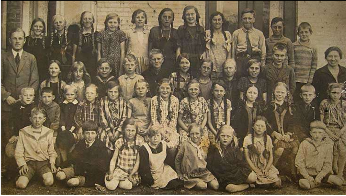
Billedet er givet til Saksøbing Lokalhistoriske Arkiv december 1990 af Kjeld Hansen, Nystedvej 79, Reg.nr. B 1437