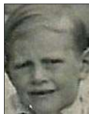
Række IV nr. 5