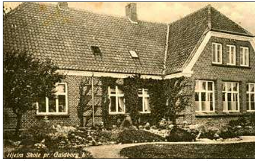
Hjelm Skole, opført 1911, nedlagt 1965. Postkort fra 1920'erne?