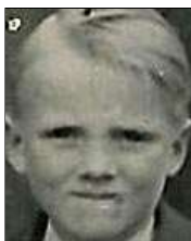
Række IV nr. 1