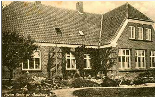
Hjelm Skole, opført 1911, nedlagt 1965. Postkort fra 1920'erne?

Kilder: Række I nr. 2 Kurt Madsen, Række II nr. 3 Erik Enggaard Peitersen, Helge Storch