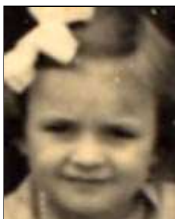
Række IV nr. 13