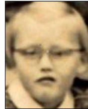
Række IV nr. 11