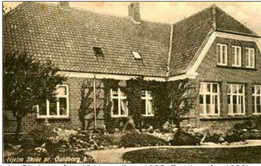
Hjelm Skole, opført 1911, nedlagt 1965. Postkort fra 1920'erne?