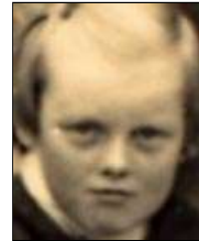
Række IV nr. 12