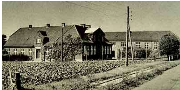
Den fjerde Kalø Skole fra 1927 indtil nedlæggelsen ca. 1966. Ribberne i skolegården er afløst af en gymnastiksal. Bemærk roesporet på Kaløvej. Postkort fra 1962?.

Realsk.1951 Sakskøbing Realsk.1953 Sakskøbing Realsk.1955 Sakskøbing Realsk.1958 Soesmarke Skole 1912 Soesmarke Skole 1938 Soesmarke Skole 1941 Soesmarke Skole 1946 Soesmarke Skole 1950 Soesmarke Skole 1954 Soesmarke Skole 1957 Tårs Skole 1955 Tårs Skole 1958 Vignæs Skole 1941 Vignæs Skole 1947