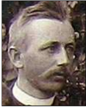
Række I nr. 1