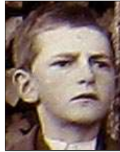
Række II nr. 10