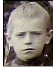
Række III nr. 1