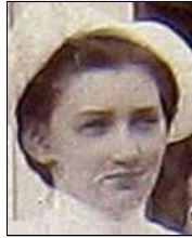
Række I nr. 7