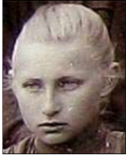
Række VI nr. 2