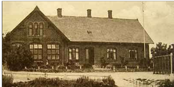
Den tredje Kalø Skole 1906-1927 med ribber til gymnastik i skolegården. Den blev opført på samme grund som skole nr. 2. Postkort fra 1920'erne?