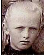
Række VI nr. 4