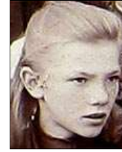
Række VI nr. 8