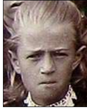
Række VI nr. 3