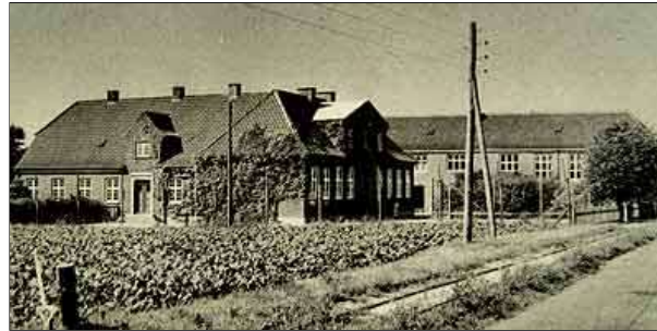
Kalø Skole opført 1927, nedlagt ca. 1966. Postkort.