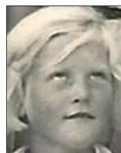
Række III nr. 6