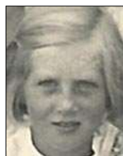
Række III nr. 5