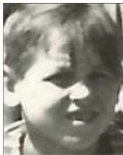
Række IV nr. 1