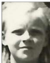
Række III nr. 3