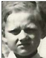
Række IV nr. 3