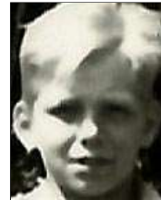
Række I nr. 6