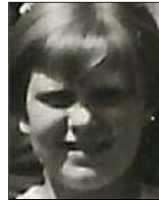
Række II nr. 12