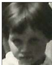
Række III nr. 8