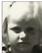
Række III nr. 5