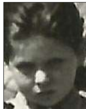
Række IV nr. 4