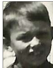
Række IV nr. 6