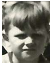
Række IV nr. 2