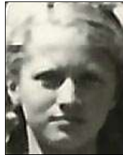
Række II nr. 10