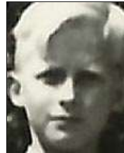
Række I nr. 10