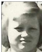
Række III nr. 2