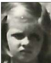
Række III nr. 7