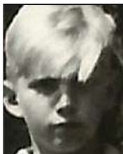
Række I nr. 13