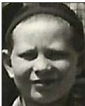
Række II nr. 13