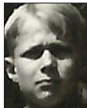
Række I nr. 14