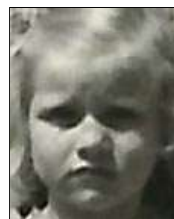
Række III nr. 12