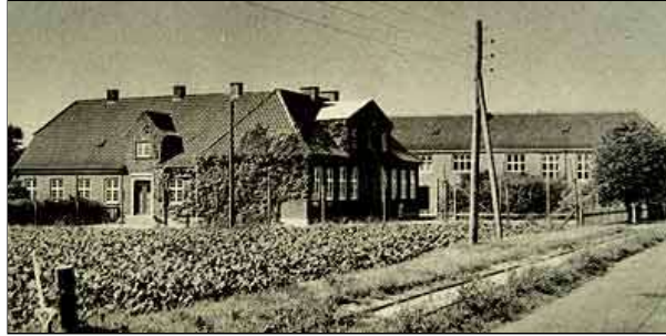
Kalø Skole opført 1927, nedlagt ca. 1966. Postkort.