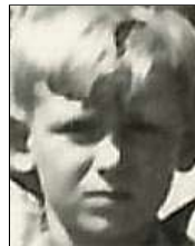
Række IV nr. 5