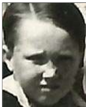
Række IV nr. 7