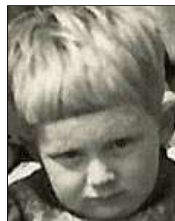
Række VI nr. 4 Lærerindens søn