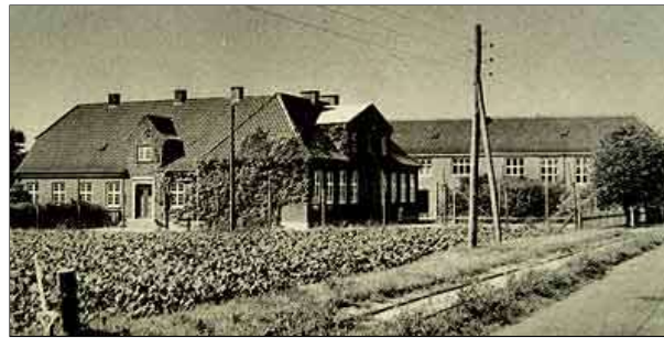
Kalø Skole opført 1927, nedlagt ca. 1966. Postkort.