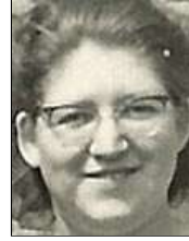
Række II nr. 11 Lærerinden