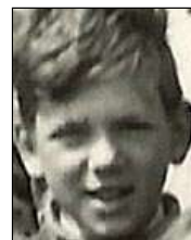
Række II nr. 3