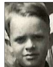
Række II nr. 4