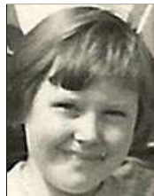
Række III nr. 10