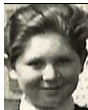
Række II nr. 2