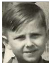
Række VI nr. 10