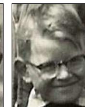
Række II nr. 6