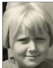
Række V nr. 11