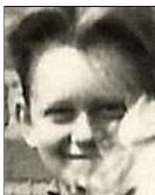
Række II nr. 1