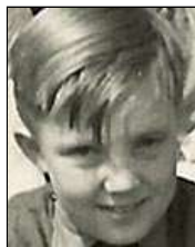
Række VI nr. 9