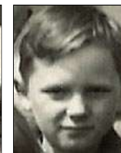
Række II nr. 5