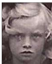
Række III nr. 2