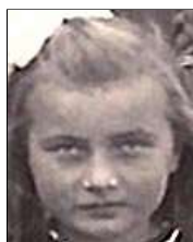
Række III nr. 8