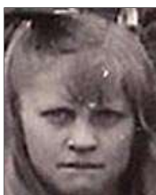
Række III nr. 1