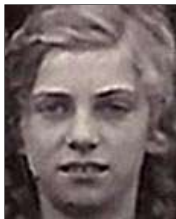
Række II nr. 1