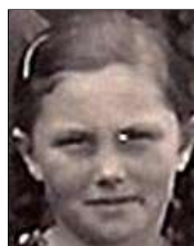
Række III nr. 10