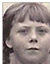
Række III nr. 6