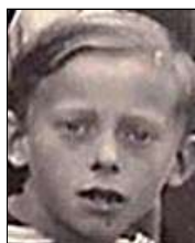
Række IV nr. 8