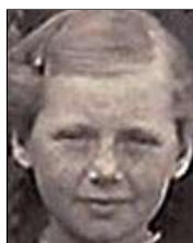
Række III nr. 9