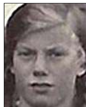
Række II nr. 9

Min moster, født 18.05.1914 død 1940