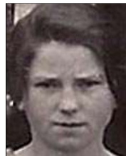
Række II nr. 2