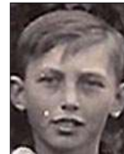
Række I nr. 6