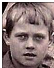
Række IV nr. 4