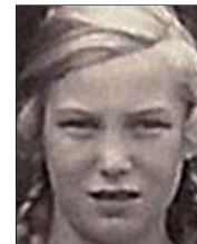
Række II nr. 6