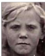
Række III nr. 3