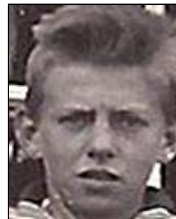
Række I nr. 3