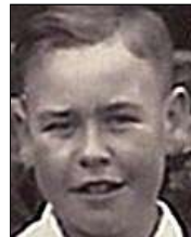
Række I nr. 4