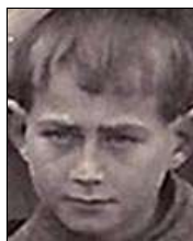
Række IV nr. 3