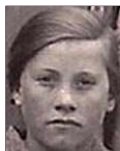
Række III nr. 5