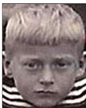
Række IV nr. 1