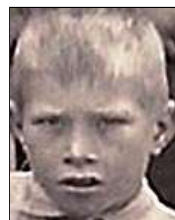
Række IV nr. 6