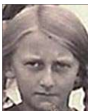
Række III nr. 7