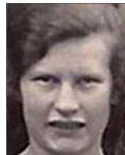
Række II nr. 4