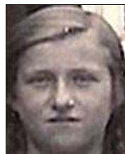
Række II nr. 8