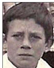
Række IV nr. 5