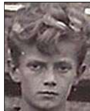
Række I nr. 2