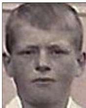
Række I nr. 7