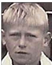
Række IV nr. 7