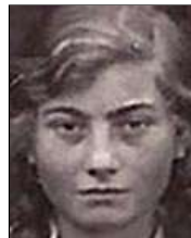
Række II nr. 3