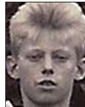
Række I nr. 5