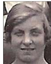
Række II nr. 5