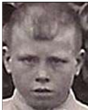
Række I nr. 1