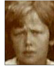
Række III nr. 5