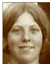
Række II nr. 6