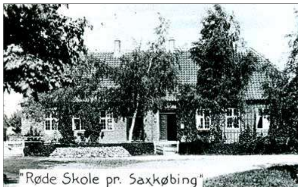
Udsnit af postkort fra 1920'erne?: Nørre Radsted Skole