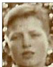
Række I nr. 4