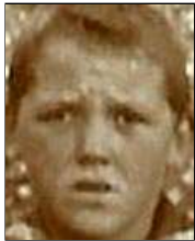
Række III nr. 7