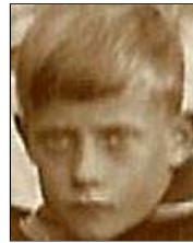
Række IV nr. 3