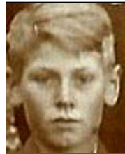
Række III nr. 8