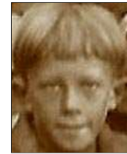
Række IV nr. 5