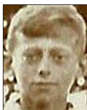
Række I nr. 9