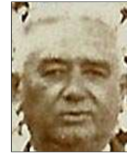
Række II nr. 11