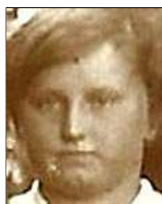
Række II nr. 1