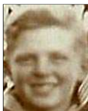
Række I nr. 3