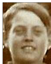
Række I nr. 6