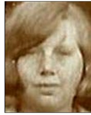
Række II nr. 9