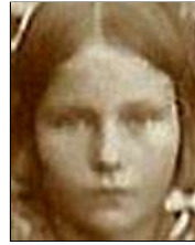
Række III nr. 3