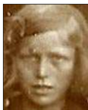
Række II nr. 2