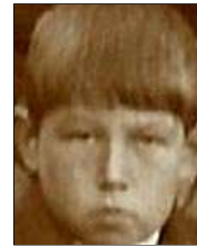
Række IV nr. 4