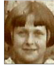
Række III nr. 6