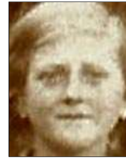
Række II nr. 10