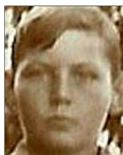
Række I nr. 1