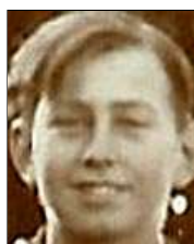
Række I nr. 7