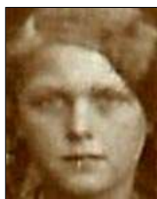
Række II nr. 3