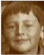
Række IV nr. 1