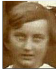
Række II nr. 8