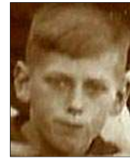
Række IV nr. 6

Sakskøbing Lokalhistoriske Arkiv Juniorsgade 35, 4990 Sakskøbing Telefon 54 70 56 04 post@saxarkiv.dk