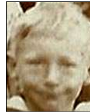
Række III nr. 10