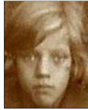
Række III nr. 2