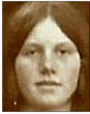
Række II nr. 7