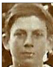
Række I nr. 8