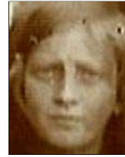
Række III nr. 4