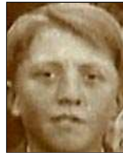
Række III nr. 9