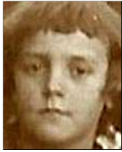
Række III nr. 1