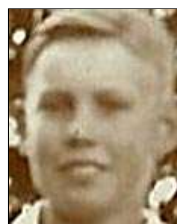
Række I nr. 5