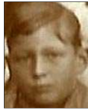
Række IV nr. 2