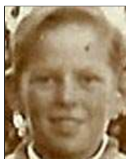
Række I nr. 2