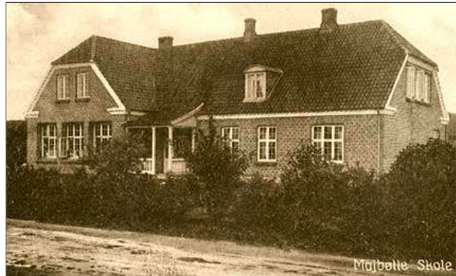
Majbølle Skole, Majbølle Byvej 60, 1917-1968. Postkort 1930'erne?

Realsk.1951 Sakskøbing Realsk.1953 Sakskøbing Realsk.1955 Sakskøbing Realsk.1958 Sakskøbing Realsk.1958 Soesmarke Skole 1912 Soesmarke Skole 1938 Soesmarke Skole 1941 Soesmarke Skole 1946 Soesmarke Skole 1950 Soesmarke Skole 1954 Soesmarke Skole 1957 Taars Skole 1955 Taars Skole 1958 Vigsnaes Skole 1941 Vigsnaes Skole 1947