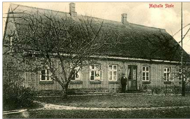
Majbølle Skole, Præstestræde 20, ca. 1800-1917. Postkort 1910'erne?