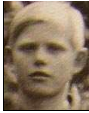
Række I nr. 7