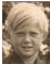
Række I nr. 4