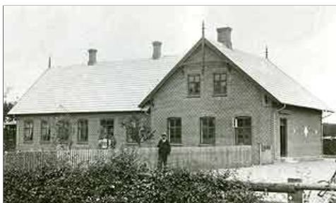
Den ny Oreby Skole fra 1920