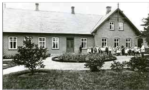
Oreby Skole efter om- og tilbygning i 1919