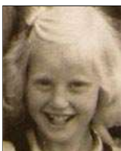
Række V nr. 6