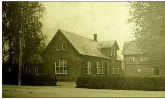
Rørbæk Skole, postkort fra 1920'erne