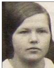
Række III nr. 2