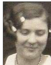
Række III nr. 5