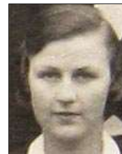
Række III nr. 6