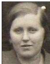
Række III nr. 3