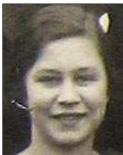
Række III nr. 1