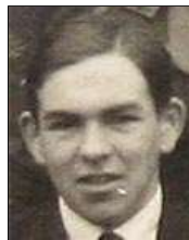
Række III nr. 4