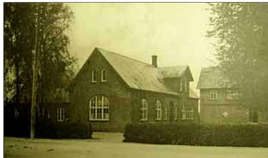
Rørbæk Skole, postkort fra 1920'erne