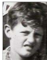
Række IV nr. 4