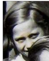
Række III nr. 10