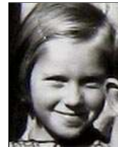
Række III nr. 11