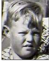
Række IV nr. 7

39 år. Fratrådte som personalechef til pension i 1989. Fritid sommerhus på Helgenæs.