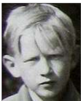
Række IV nr. 1