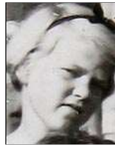
Række III nr. 3