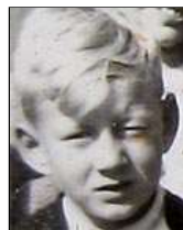
Række IV nr. 3