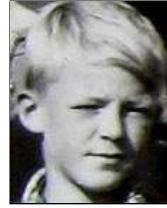
Række IV nr. 10