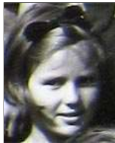
Række III nr. 8