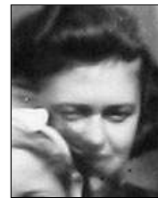
Række I nr. 6