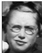
Række II nr. 4