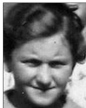
Række II nr. 2