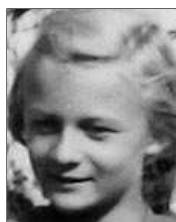
Række II nr. 9