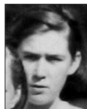
Række I nr. 10