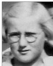
Række II nr. 3