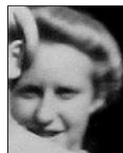
Række I nr. 11