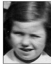
Række IV nr. 5