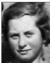
Række III nr. 1