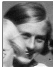
Række I nr. 3