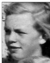
Række III nr. 3