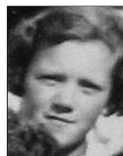
Række II nr. 12