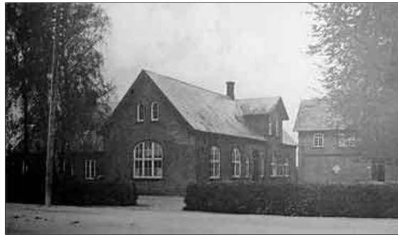
Rørbæk Skole, postkort fra 1920'erne