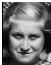
Række III nr. 4