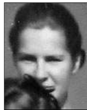
Række I nr. 2