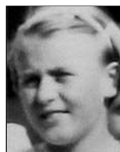
Række II nr. 11