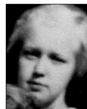
Række I nr. 12