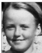
Række II nr. 8