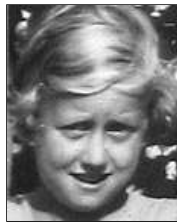
Række IV nr. 2