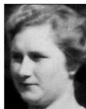
Række I nr. 9