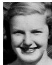
Række III nr. 6