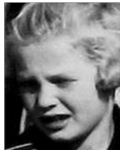
Række IV nr. 9