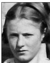
Række III nr. 7