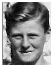
Række III nr. 5