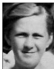
Række II nr. 10