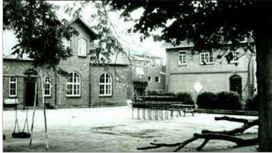
Rørbæk Skole efter udvidelsen i 1956