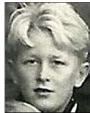
Række II nr. 4