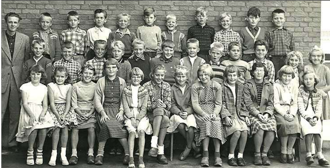
Billedet er i digital form givet til Saksøbing Lokalhistoriske Arkiv af Række I nr. 2 Leif Christensen december 2014

Send en mail til webmaster@saxarkiv.dk hvis du har oplysninger om personerne på billedet.