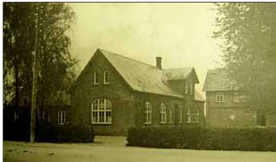
Rørbæk Skole, postkort fra 1920'erne