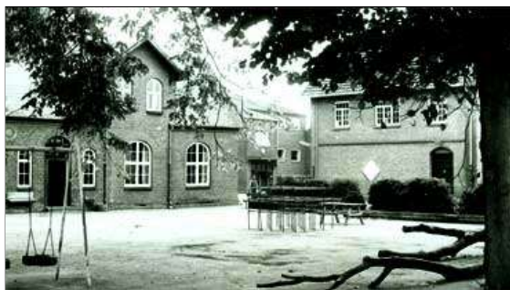
Rørbæk Skole efter udvidelsen i 1956