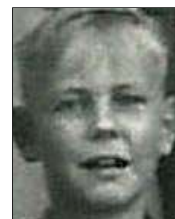
Række I nr. 6 Bent ?, Rosenvang