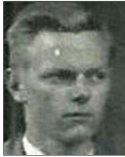
Række I nr. 7