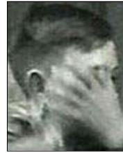
Række I nr. 11