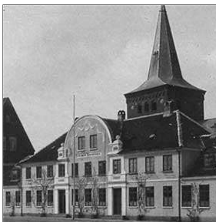
Saksøbing Borgerskole 1847-1965 med til- og ombygning 1912