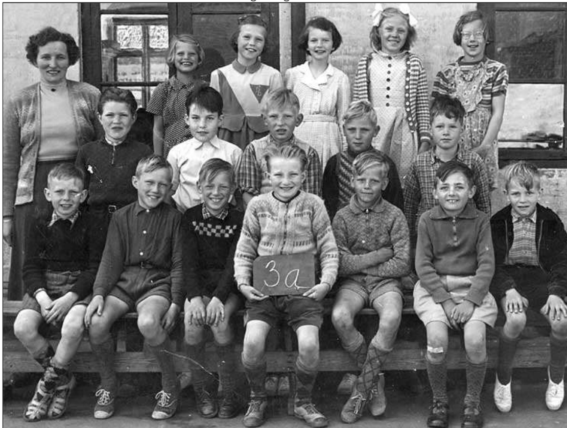
Billedet er i digital form givet til Sakskøbing Lokalhistoriske Arkiv af Preben Axelsen marts 2013

Send en mail til webmaster@saxarkiv.dk hvis du har oplysninger om personerne på billedet.