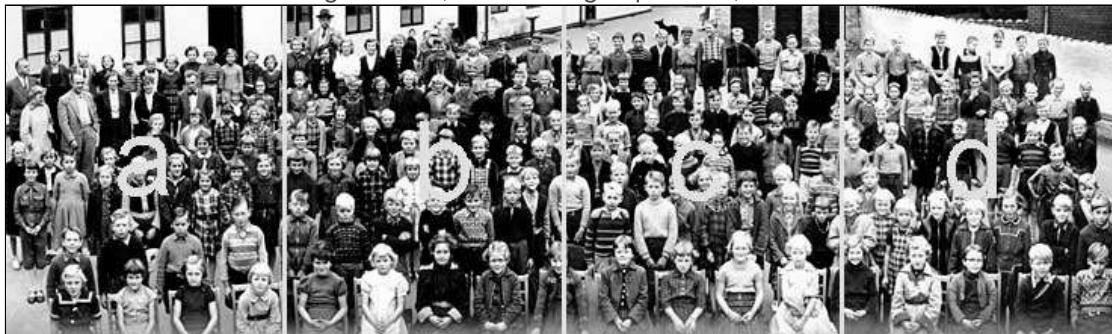
Panoramabilledet er opdelt i 4 udsnit. Klik på det udsnit, du vil se!