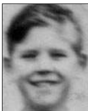
Række I nr. 7