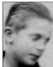
Række I nr. 5