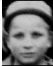
Række II nr. 3