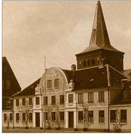
Sakskøbing Borgerskole 1847-1965 med til- og ombygning 1912