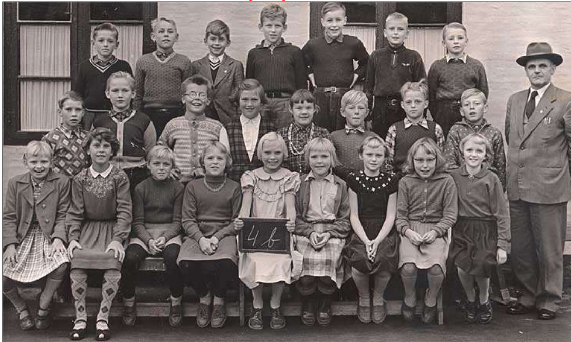
Billedet er givet til Sakskøbing Lokalhistoriske Arkiv af Lise Autzen januar 2013. B3238