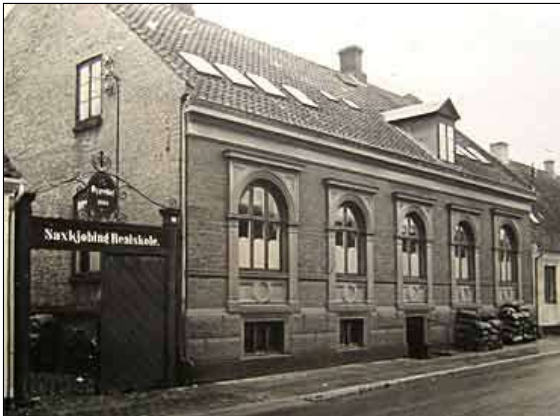
Vestergade 21 rummede Saksøbing (Private) Realskole 1888-1954.