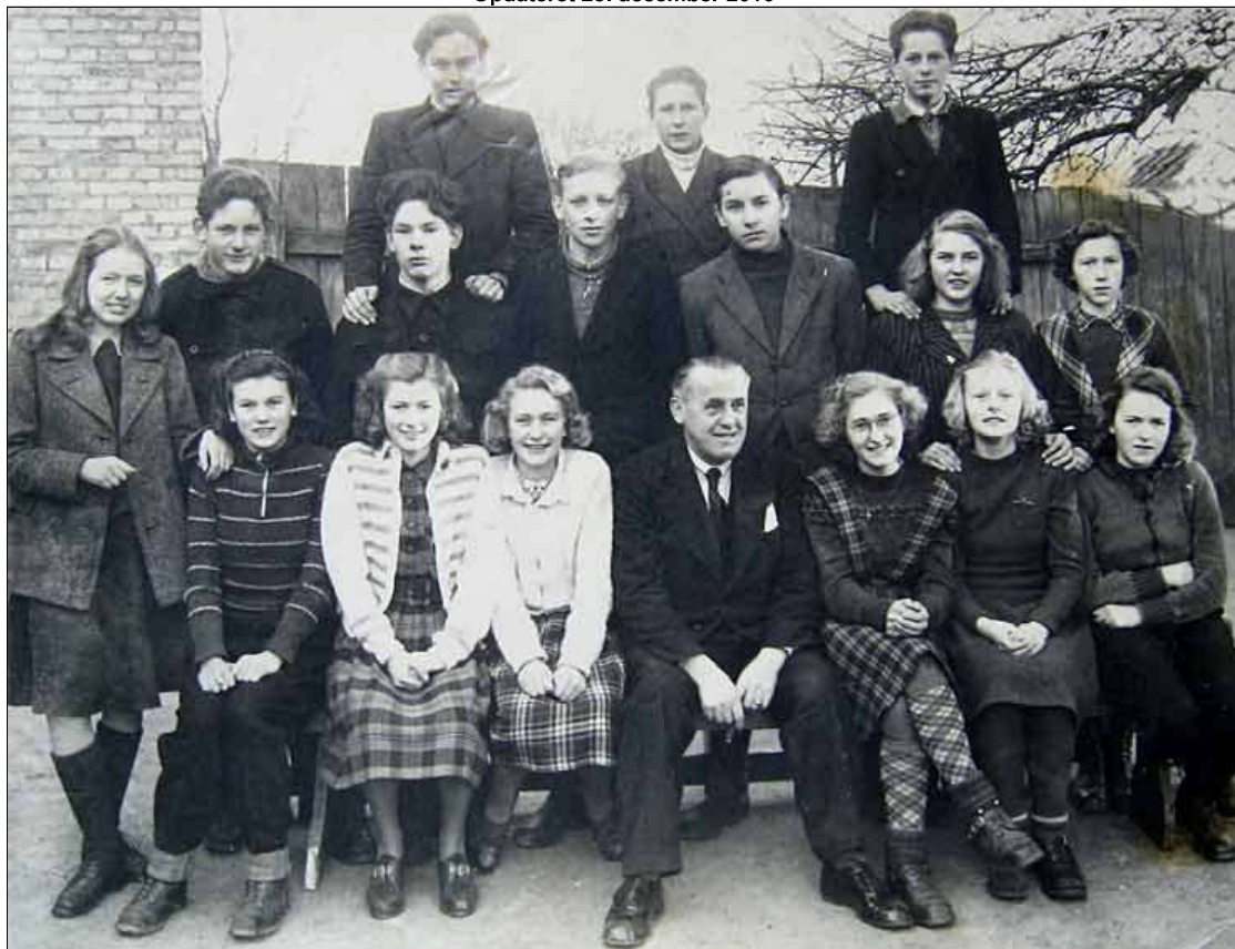
Billedet er taget med her, fordi det er meget bedre end det officielle dimissionsbillede. 2 drenge var fraværende den dag

Billedet er taget i anledning af besøg fra venskabsbyen Växjö i Småland og udlånt af Bent Tambour, Guldborg, januar 2011 Opdateret 28. december 2016