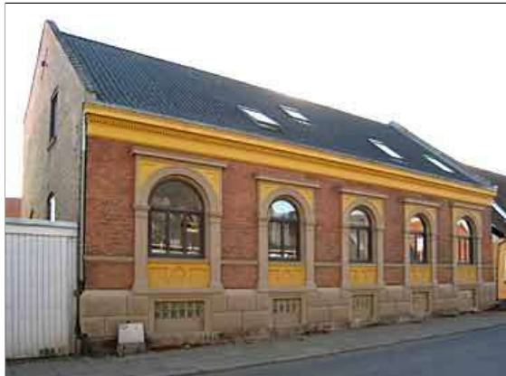
Vestergade 21 er i dag indrettet til lejligheder. Foto 14. oktober 2010, Niels Nordby Christensen