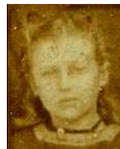
Række II nr. 5