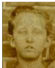
Række I nr. 9