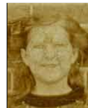
Række I nr. 8