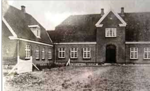
Soesmarke Skole, Guldborgvej 228, opført 1917. Samtidig foto