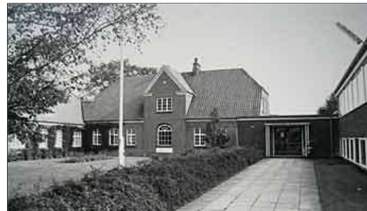
Soesmarke Skole udvidet og omdøbt til Guldborgland Centralskole i 1958. Foto fra 1980