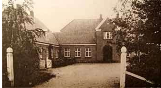
Soesmarke Skole opført 1917. Postkort fra 1920'erne