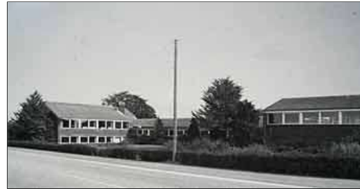
Soesmarke Skole udvidet og omdøbt til Guldborgland Centralskole 1958. Nedlagt 2011. Foto fra 1980