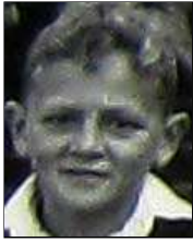
Række IV nr. 1