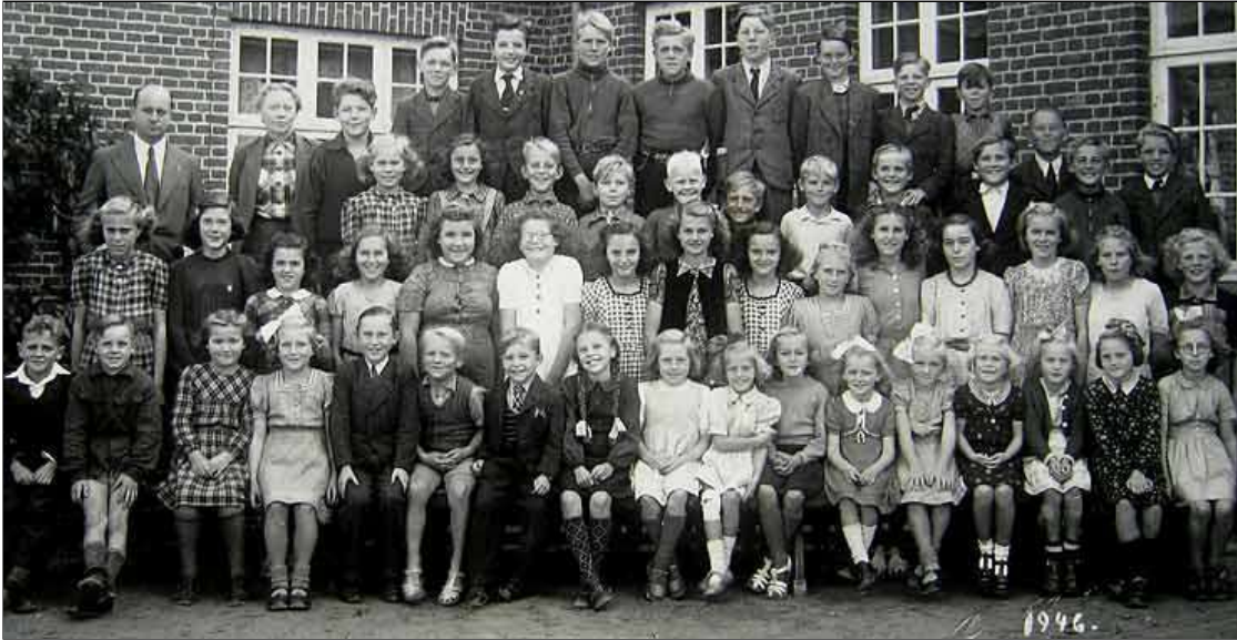
Billedet er i digital form givet til Sakskøbing Lokalhistoriske Arkiv af Bent Tambour juli 2011