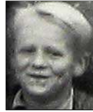
Række IV nr. 6