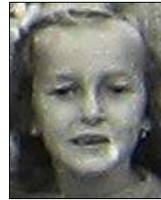
Række IV nr. 11