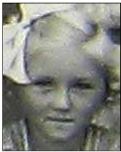
Række IV nr. 13