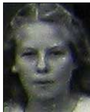
Række III nr. 14