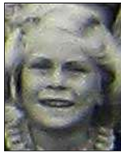
Række IV nr. 14