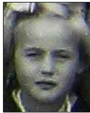
Række IV nr. 15