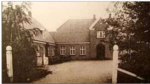
Soesmarke Skole opført 1917. Postkort fra 1920'erne