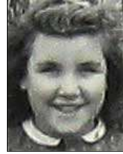
Række III nr. 5