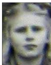
Række III nr. 16