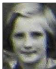
Række III nr. 14