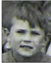
Række IV nr. 2