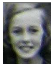
Række III nr. 17