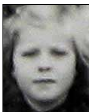
Række III nr. 7