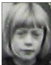
Række III nr. 9