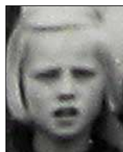
Række III nr. 8