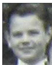
Række I nr. 2