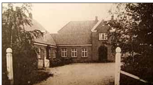
Soesmarke Skole opført 1917. Postkort fra 1920'erne