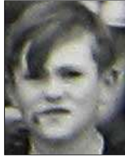
Række IV nr. 9