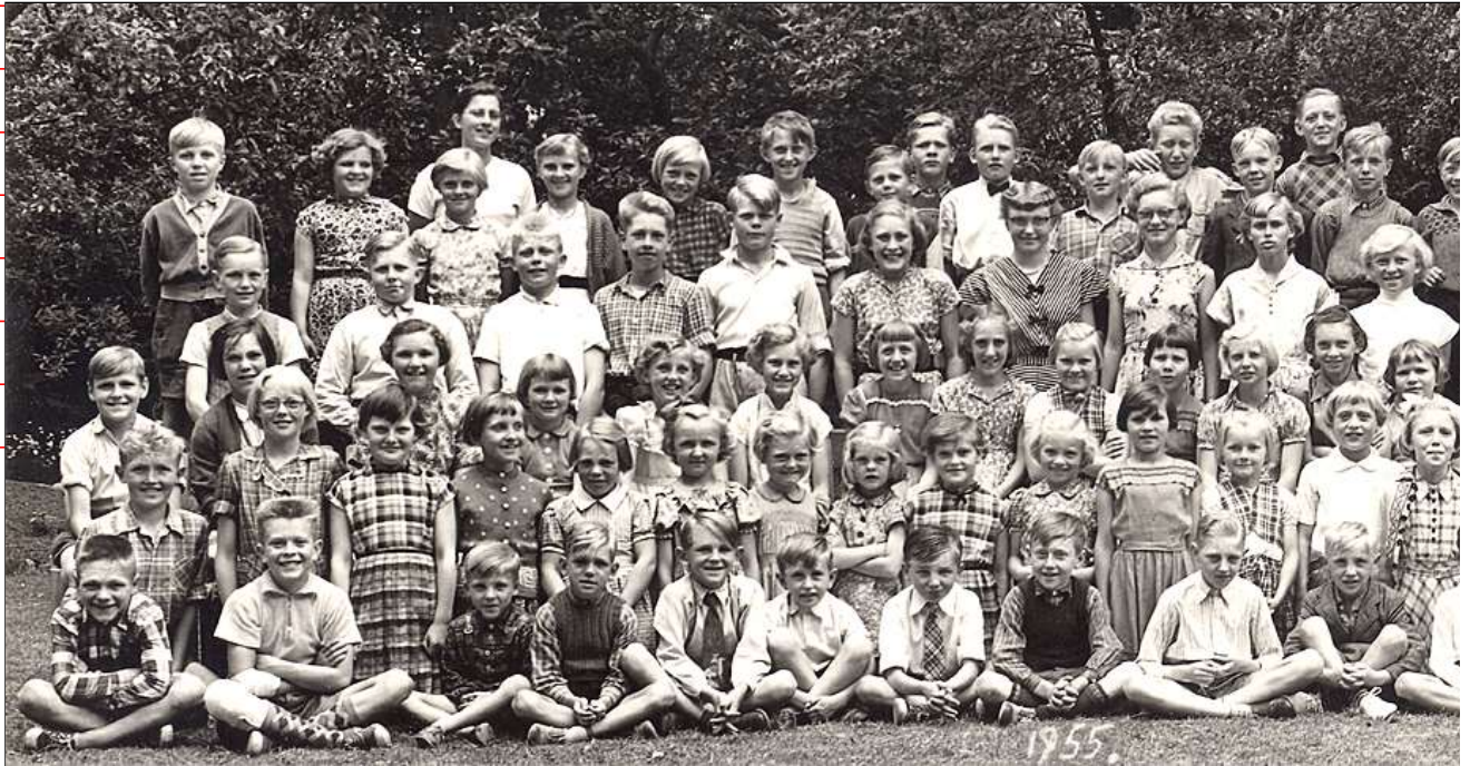
Billedet er i digital form givet til Saksøbing Lokalhistoriske Arkiv i juli 2013 af udsnit b Række V nr. 1 Henning Pedersen