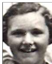
Række III nr. 3