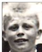
Række II nr. 3