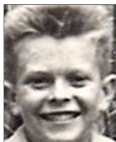
Række V nr. 2