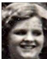
Række I nr. 2