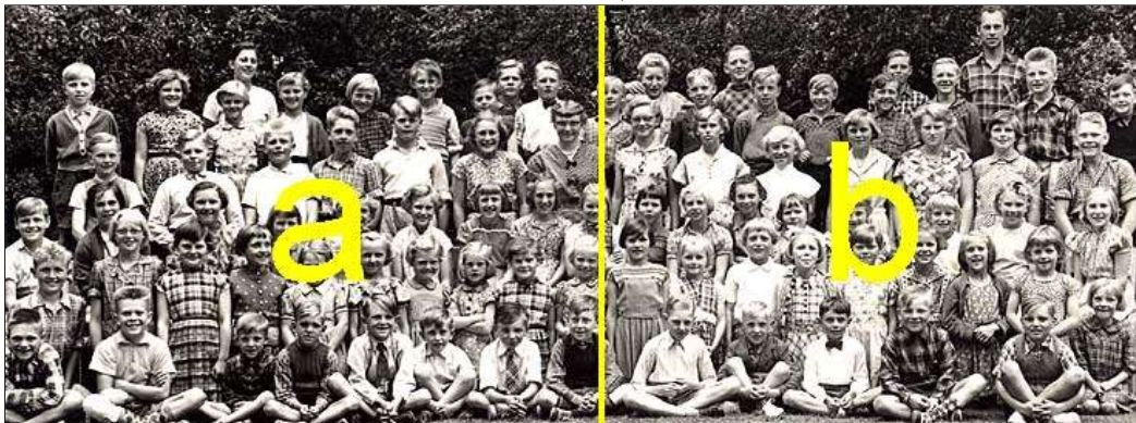
Billedet er opdelt i 2 udsnit. Klik på det udsnit, du vil se!