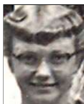
Række II nr. 7