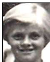
Række I nr. 3