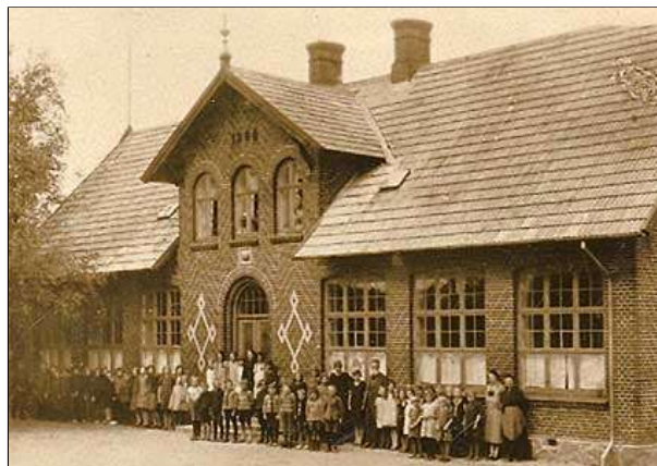
Taars Skole opført 1904