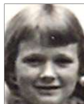
Række III nr. 4