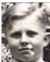
Række II nr. 2