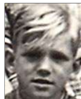
Række V nr. 4