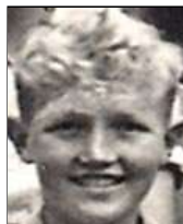
Række IV nr. 1