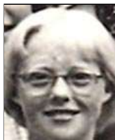
Række IV nr. 2