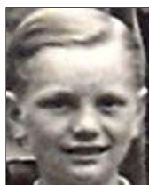
Række II nr. 1