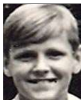
Række III nr. 1