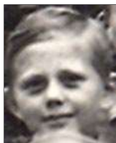
Række I nr. 8