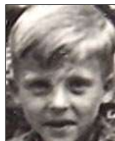
Række V nr. 3