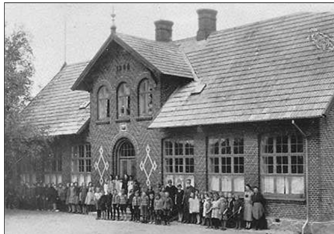
Taars Skole opført 1904