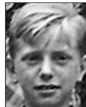
Række I nr. 5