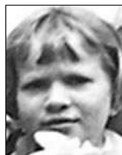
Række III nr. 4