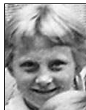
Række III nr. 5