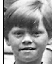
Række IV nr. 5