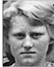
Række II nr. 5