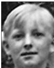
Række I nr. 1