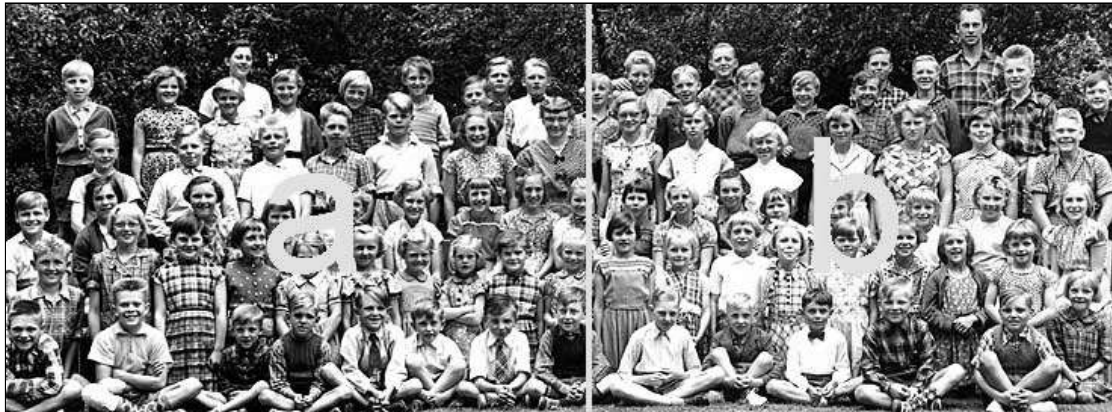
Billedet er opdelt i 2 udsnit. Klik på det udsnit, du vil se!