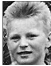
Række I nr. 11