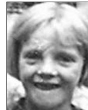
Række V nr. 6