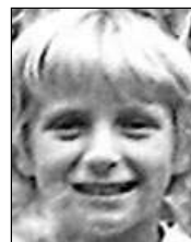
Række III nr. 6