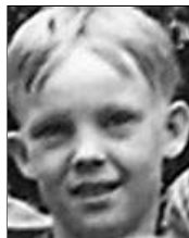
Række I nr. 3