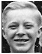
Række I nr. 9