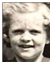
Række V nr. 3