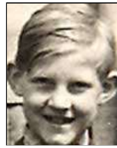
Række IV nr. 5