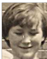
Række I nr. 10