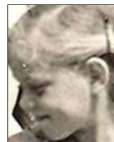
Række VI nr. 5