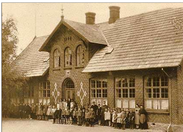
Taars Skole opført 1904