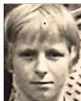
Række II nr. 3