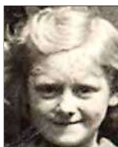
Række V nr. 2