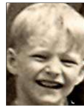
Række IV nr. 12