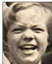
Række II nr. 12