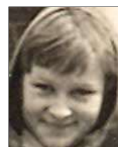
Række I nr. 12