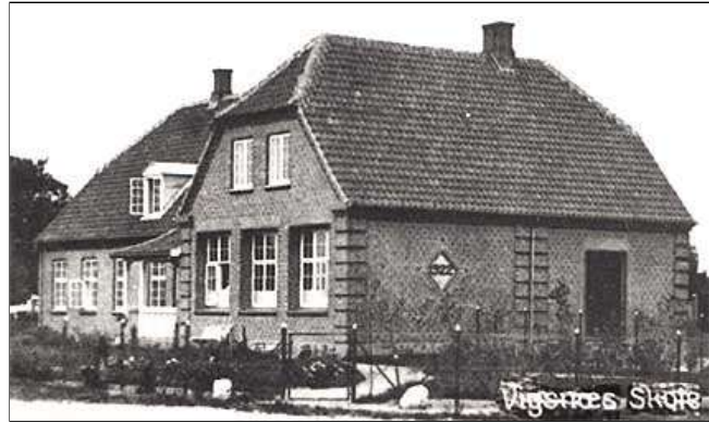
Vignæs Skole bygget 1922. Uddrag af postkort fra 1920'erne?