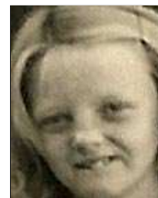
Række IV nr. 6