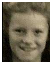
Række II nr. 2