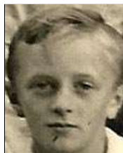
Række IV nr. 2