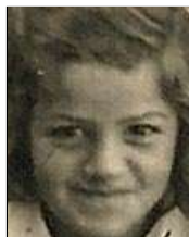
Række IV nr. 3