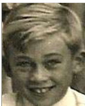
Række IV nr. 1