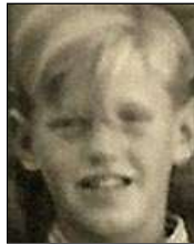
Række III nr. 7