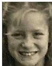
Række IV nr. 4