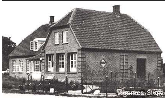
Vignæs Skole bygget 1922. Uddrag af postkort fra 1920'erne?