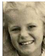
Række IV nr. 5